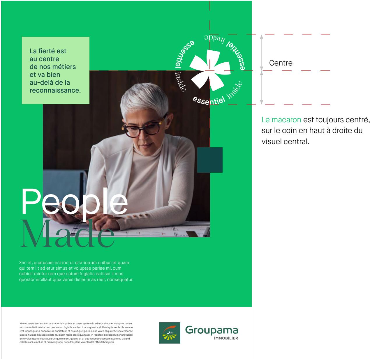
1.Placement du macaron sur le visuel

Le macaron est blanc sur un visuel fond coloré ou photo